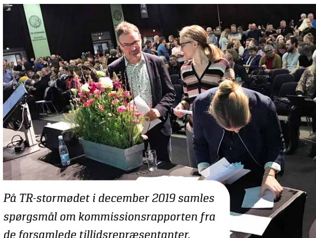
På TR-stormødet i december 2019 samles spørgsmål om kommissionsrapporten fra de forsamlede tillidsrepræsentanter.

Lærerne er eksperter i undervisning. Det er afgørende, at lærerne har professionelt råderum til at udøve deres dømmekraft. Næstved Lærerkreds arbejder på at udbrede forståelsen af, at undervisning er et komplekst fænomen, og at der er mange veje til målet. Dette er et paradigmeskift i forhold til ideerne bag den målstyrede undervisning, der var dominerende i årene efter skolereformen. Næstved Lærerkreds tilslutter sig, at lærerne er helt centrale aktører i bestræbelserne på, at skolen lykkes med sine mange opgaver. Vi har deltaget i en møderække med CDS og de pædagogiske ledere og skole-TR, hvor vi har drøftet betydningen af de nye pejlemærker for fælles mål samt den meningsfulde brug af læringsplatformen. Vi er ikke i mål endnu – men dialogen er igangsat. Det øgede råderum og muligheden for at udøve professionel dømmekraft skal kunne mærkes hos den enkelte lærer ude i klasselokalet. Næstved Lærerkreds er derfor naturligvis også med ved de regionale fagmøder, hvor repræsentanter fra Børne- og Undervisningsministeriet, Kommunernes Landsforening, Skolelederforeningen og Børne- Kulturchefforeningen i samarbejde med DLF arbejder for at sikre, at intentionerne om et større lokalt råderum i lovændringen om fælles mål realiseres lokalt,