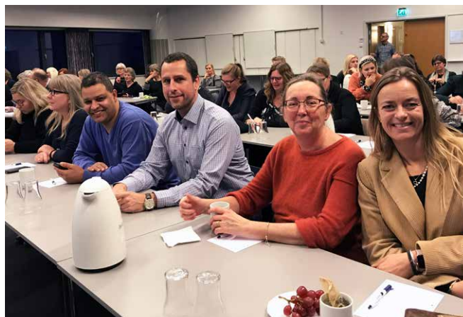
Susåskolen er på alle måder godt repræsenteret på Åbent Kursus.

OBS! ER DU OPMÆRKSOM PÅ, AT DIN MÅNEDSLØN ER STEGET NÆSTEN 1000 KR. SIDEN 1/10 2019?